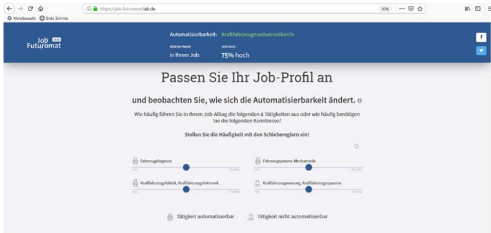
Abb. 3: Job Futuromat – Screenshot der Tätigkeitsfeld-Regler im Beruf „Kfz-Mechatroniker/in“ (Stand: 16.06.2020)

Wenngleich die Gefahr besteht, dass diese externen Faktoren einer potenziellen Substituierbarkeit bei einer beruflichen Neuorientierung überbewertet werden, ist dieses Tool gleichzeitig ein gut überschaubares Werkzeug, um sich mit dem Thema auseinander zu setzen. Die Thematik einer zunehmenden Substituierbarkeit durch die fortschreitende Automatisierung sollten sich junge Arbeitnehmer/innen meiner Ansicht nach bewusst sein, um mündige Entscheidungen für die eigene Berufs- / Studienwahl treffen zu können.